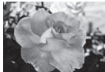
ピンク パラダイス