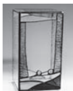
作品例(植物などを觀賞するテラリウム)

期日 ①木曜日コース 6月1日、8日、15日、22日 ②金曜日コース 6月2日、9日、16日、23日 ③土曜日コース 6月3日、10日、17日、24日 時間 ①③午前9時～正午 ②午後1時～4時 定員 各8人(抽選) 参加費 1万1000円