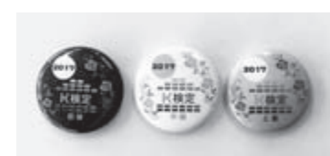
記念品の缶バッジ

K検定とは可児市の特徴を集めた検定クイズです。現在挑戦できるのは初級問題（小学校高学年レベル）ですが、夏頃には中級・上級問題を作成予定です。 誰でも参加でき、合格者には記念品をお渡しします。市ホームページから参加できる他、総合政策課または各連絡所で問題用紙を配布します。みなさんK検定にチャレンジして、可児市のことをもっと知ってみませんか。 詳細は市ホームページ（ http://www.city.kani.lg.jp/12335.htm ）でご確認ください。