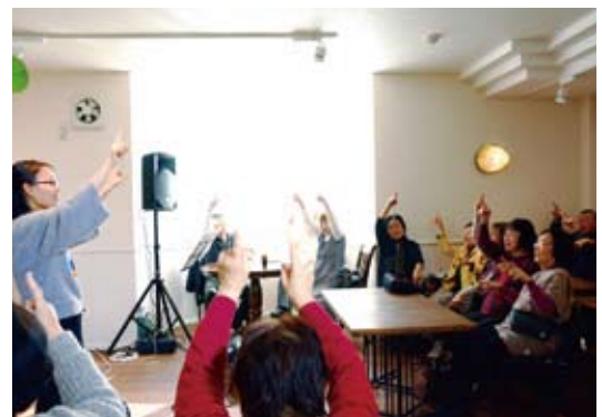
認知症予防体操をする参加者（もりのさちカフェ）

援センターも、可児とうの病院のご協力のもと1つ増やし、市内6カ所となります。より地域の実情に合わせてような体制としていきます。認知症になっても、80%以上の方が、周りの支援があれば、生き生きと生活していくことができます。ご家族や周囲の理解を得ながら、認知症の方も住み慣れた地域で安心して暮らしていける。「住みごこち一番可児」は、そんなまちづくりを目指しています。