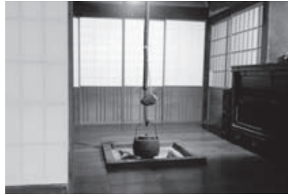
旧荒川豊蔵邸のいろり