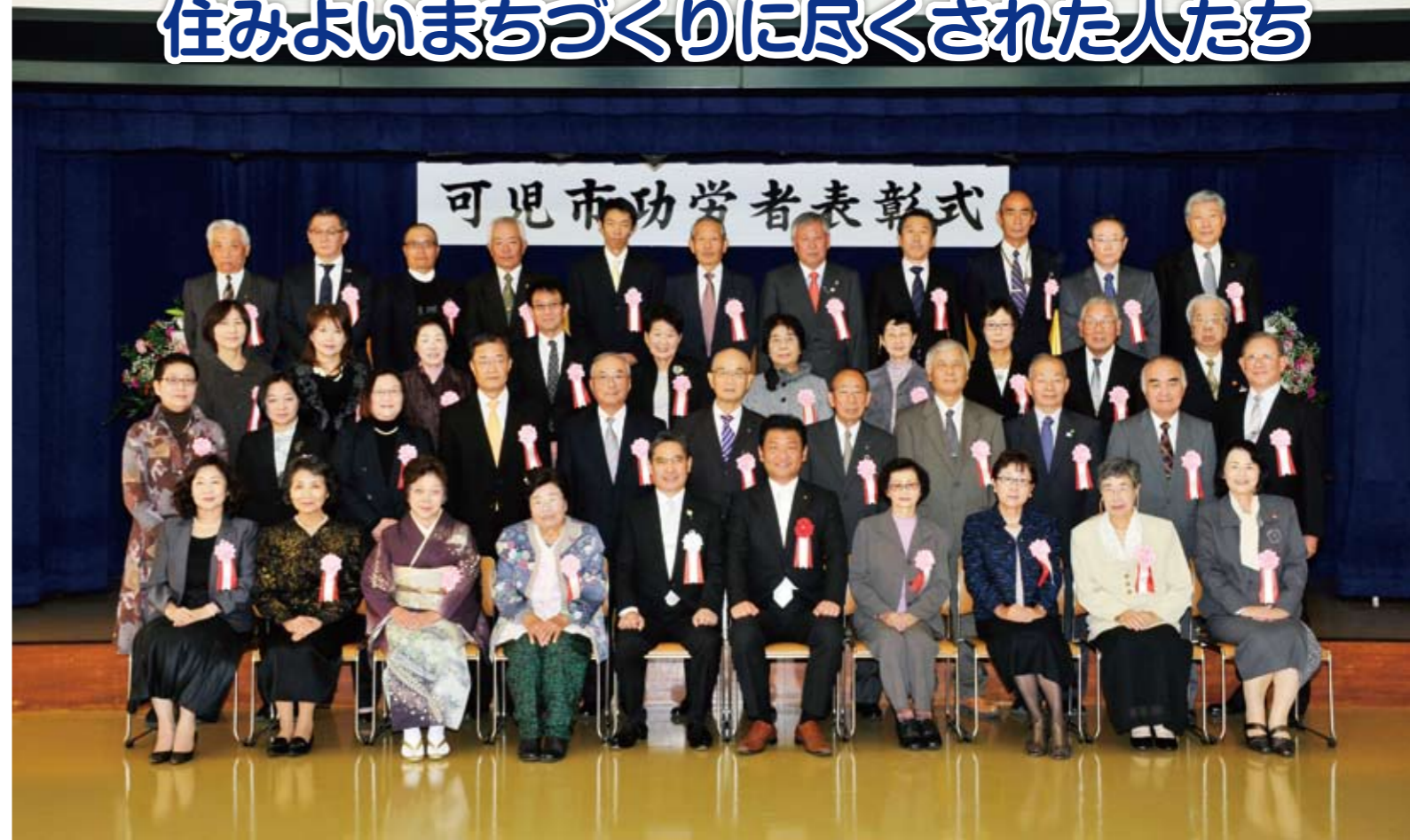
市は11月3日(祝)に、市政発展のために多年尽くされた人、他の模範となる行いをされた人など10部門46人と7団体の功労者を称える表彰式を開催しました。