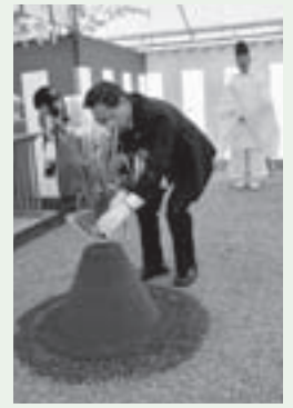
安全祈願祭の様子