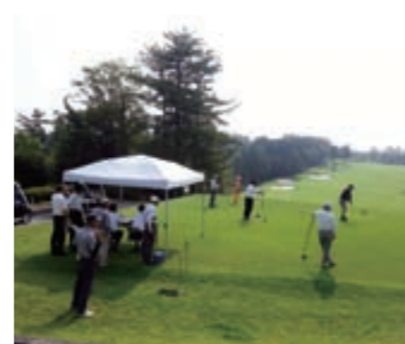
可児市長杯争奪ゴルフ大会の様子

このように、ゴルフ場は可児市 の交流人口拡大や、財政にとつて 大切な資源であり、もつともっと 活用する必要があります。そのた め、可児市の地方創生の大きな柱 として進めている「可児市観光グ ランドデザイン」の7本の柱の1