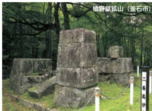
橋野鉄鉱山（釜石市）