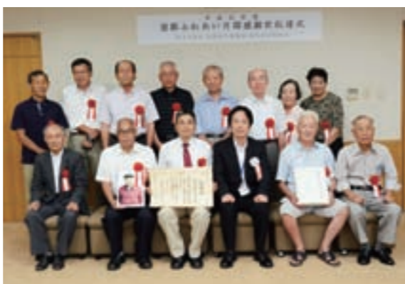
鳩吹山を緑にする会の皆さん

表彰を受けた同会メンバーは受賞を喜び合い、「時には大変なこともあるが、仲間と共にこれからも活動を続けていきたい」と今後の抱負を述べました。