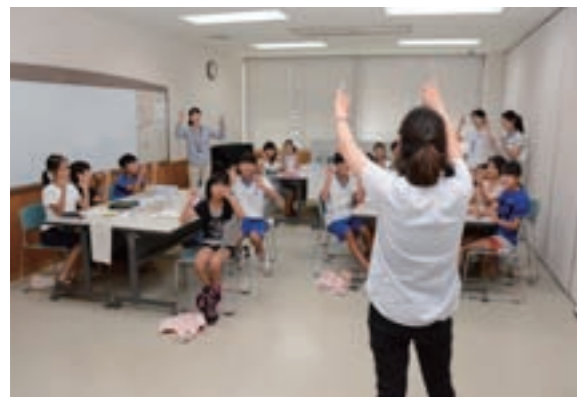
手遊びで脳を活性化しよう