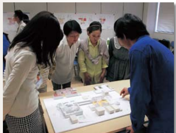
模型を見ながら話し合う参加者

市は市民の意見を反映させた施設にするために、今後もワークショップを重ねていく予定です。