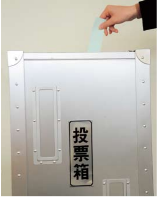
平成24年第46回衆議院議員総選挙の投票状況 ～年代別の投票率～ (※小選挙区の数値)

この選挙は、私たちの声を国政に届ける大切な選挙です。 あなたの大切な一票を生かすよう、投票にお出掛けください。