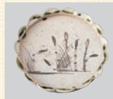
青織部土筆絵皿 (あおりべつくしえざら)

草の間から頭をのぞかせる土筆や、枝ぶりの良い梅の花の絵柄もさることながら、デザイン性のある縁取りや、方形の皿に丸い窪みといった器の形にまで趣向が凝らされています。