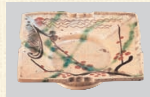
青織部梅樹絵台付向付 (あおりべばいじゅえだいつきむこうづけ)