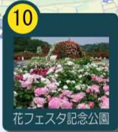
花フェスタ記念公園