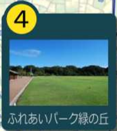
ふれあいパーク緑の丘