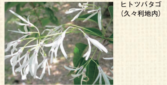
ヒトツバタゴ (久々利地内)