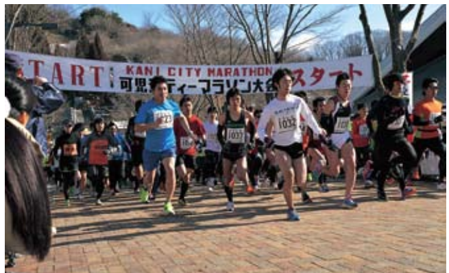
一斉にスタートする参加者

タイムレースで先頭を目指す人やジョギングで汗を流す人、今年から部門に加わった仮装の部に参加する人など、早春の公園を楽しんでいました。