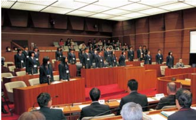
意見書を採択する可児高校の生徒