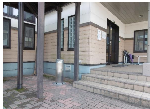
体育室入り口横の喫煙所

正面玄関入り口横と体育室側入り口横の館外2箇所であった喫煙場所を、幼い子どもたちが通う幼稚園に隣接していること及び近隣の方にも配慮し、幼稚園や住宅から離れた体育室側入り口横の1ヶ所のみとしました