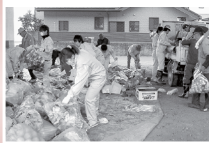
ごみを分別する様子