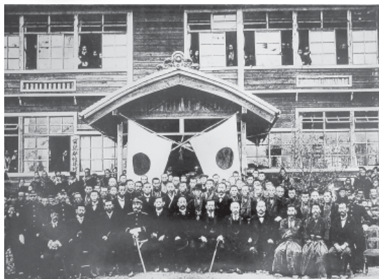
明治42年の帷子小学校新校舎落成式の様子