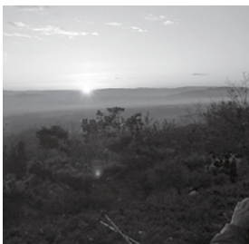
初日の出（鳩吹山・昨年）

○山中での火気の使用、ゴミ捨てなど自然を壊す行為や、ヘットの連れ込みは禁止されています ○駐車場に限りがありますので、徒歩または乗り合わせをお願いします