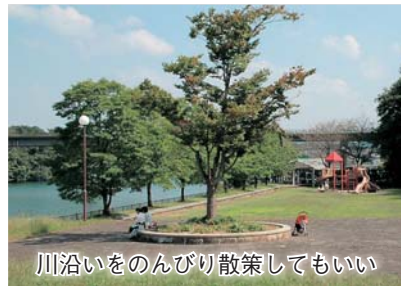
川沿いをのんびり散策してもいい