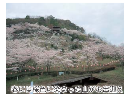
春には桜色に染まった山がお出迎え