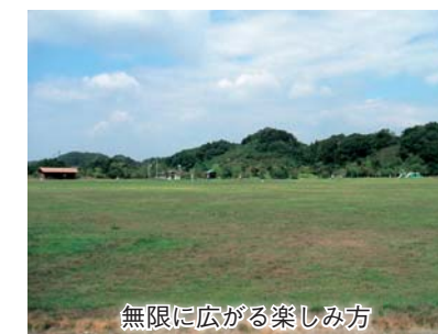
無限に広がる楽しみ方