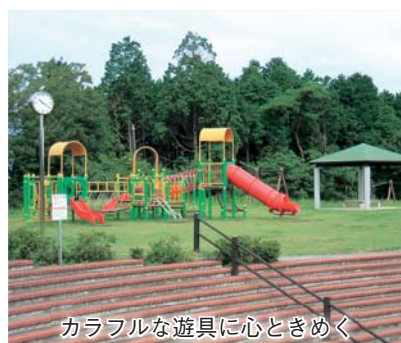
カラフルな遊具に心ときめく