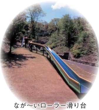
なが～いローラー滑り台