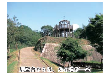
展望台からは、ため池が一望