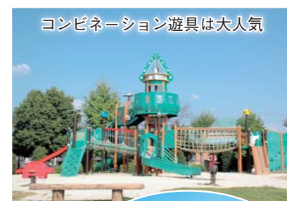
コンビネーション遊具は大人気

トイレ P36台 複合遊具 他砂場、テニスコート(手続きが必要・ナイター設備あり)