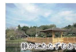
静かにたたずむあずまやで一休み