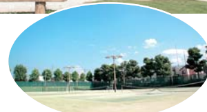
公園に隣接するテニスコート