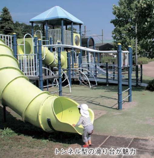
トンネル型の滑り台が魅力