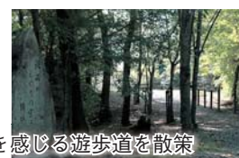
文学と歴史を感じる遊歩道を散策