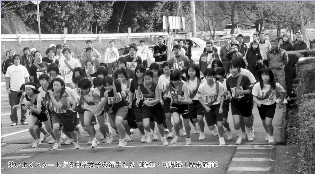
勢いよくスタートする中学女子の選手たち (昨年・可児郷土歴史館前)