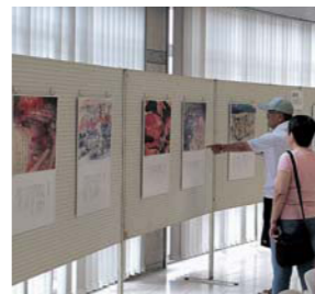
昨年の展示の様子

期間 8月10日(火)～15日(日) 時間 午前9時～午後4時 場所 広見公民館ゆとりピア