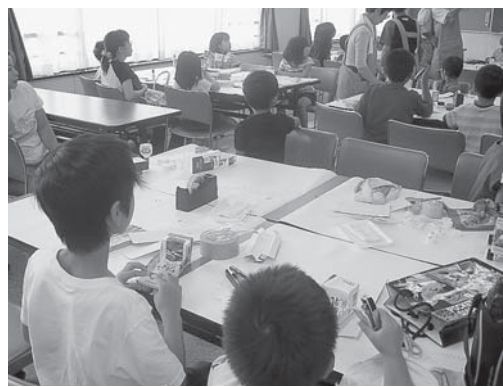
牛乳パックのトラックを作る昨年の様子

定員 50人(先着順) ※親子での参加も可。 参加費 無料 申込開始 7月27日(火) ※市役所駐車場を利用していただく場合もあります。