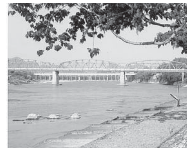
昨年度の最優秀賞作品

作品展示 ○市役所ロビー11月1日(月)～5日(金) ○今渡公民館11月6日(土)～13日(土) ○土田公民館11月14日(日)～20日(土)