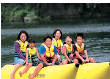
バナナボートを体験する参加者

【場所】 八百津町B&G海洋センター艇庫(八百津町蘇水公園内) 【対象者】 小学4年生以上(種目によっては3年生以下も参加可能) 【参加費】 500円 【持ち物】 飲み物、健康保険証の写し、ぬれても良い服・靴 【参加方法】 現地で受け付け ※事前の申し込みは不要です。 ※天候(水温・水量・雷など)により中止になる場合があります。