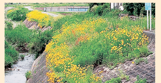
河川敷に咲く様子

人の手でこれ以上広げないようにするため、一般の家庭や畑に植えている場合は除草が必要です。自宅の庭に生えている場合は、根から引き抜き、その場で広げないようにして、2～3日天日にさらすなど枯死させた後、ビニール袋などで密閉して燃えるゴミとして出してください。