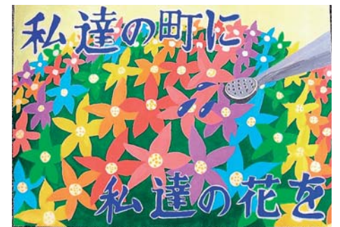
昨年の会長賞作品

※応募は1人1作品です。 ※表彰を行います。また、最優秀作品は来年の花いっぱい運動でポスターなどの図案に使用します。