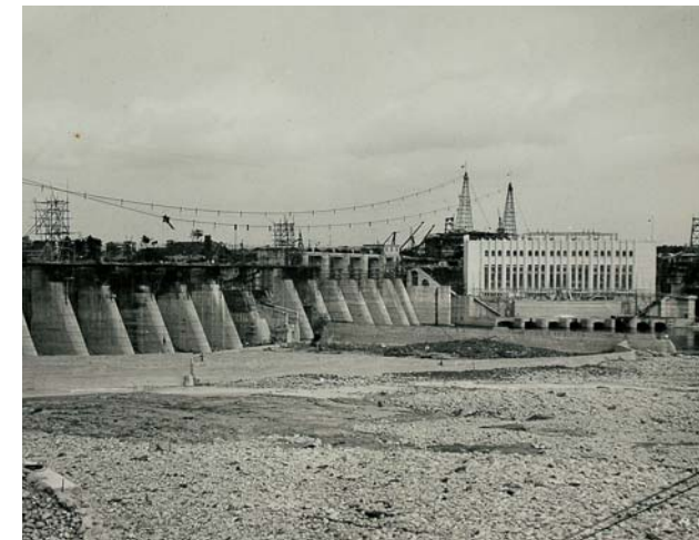
昭和13年8月、完成間近の今渡ダム

撃ち終わると持ち前の明るさで場を和ませる中西さん。「アーチェリーは、いつからでも始められるスポーツ。自分のペースで好きなだけでき、手軽に楽しめるのが魅力」と語ります。さまざまな年齢層の仲間と励まし合い、次の大会を目指しています。