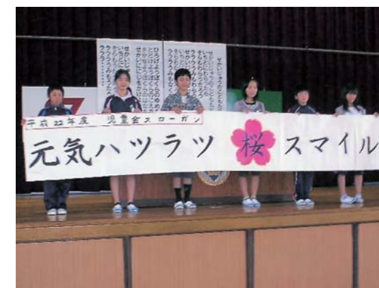
児童会のスローガンを掲げる子どもたち

創立：昭和55年 児童数：697人 所在地：桜ヶ丘5-55-2 電話：64-0700