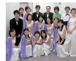
猿のメンバー 団員募集中!