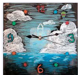
▲ガラスに絵を描いた時計