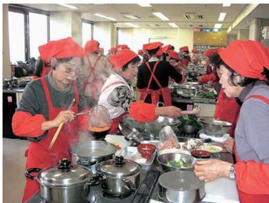
食生活改善推進協議会の研修風景