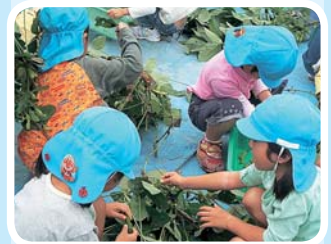
枝豆の収穫を体験する園児たち

地区公民館で行われる料理教室などの啓発活動を通じて、食生活の改善など自ら実践できる力を引き出していきます。