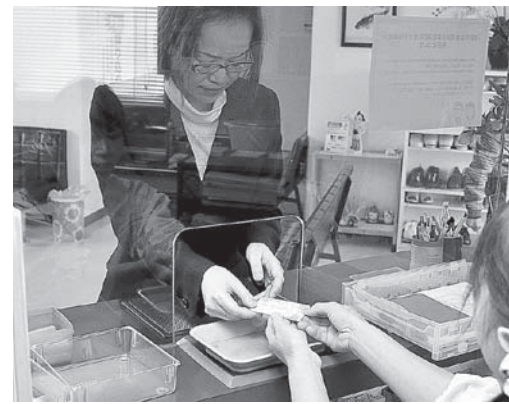
国保で運営される診療所の窓口

加入している皆さんに納めていただく国民健康保険税（以下「保険税」とい）と、国や県からの支出金などで運営されています。