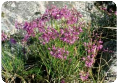
※生育地については非公表。