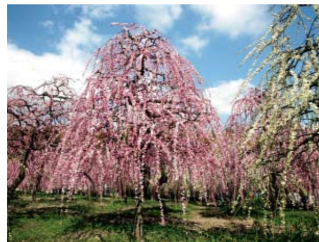
▲しだれ梅