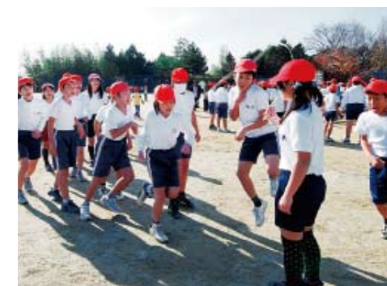
心を一つに大縄跳び

児童数:796人 学級数:25クラス 所在地:広見71-1 電話:62-1551