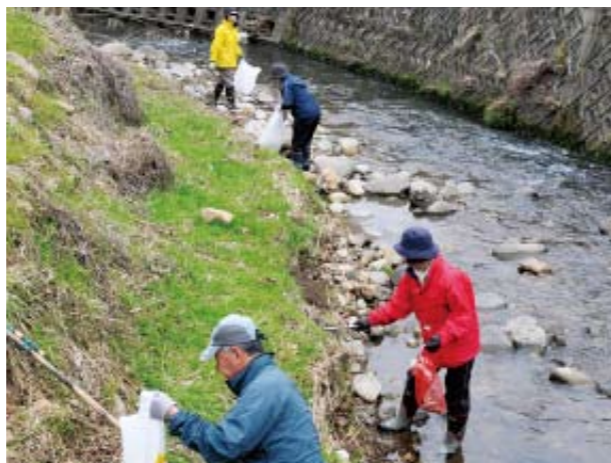
カタクリの開花時期に合わせた清掃活動