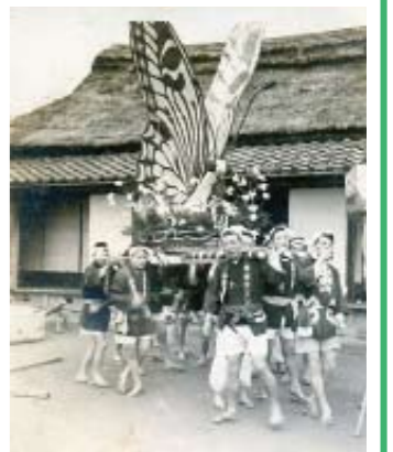
可児町の誕生を記念して出されたおみこし(個人蔵)