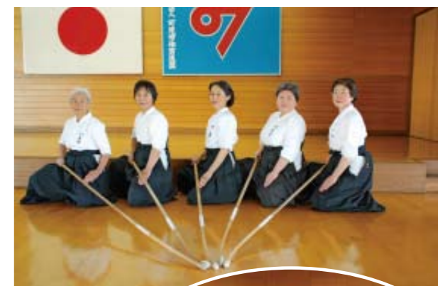
▲市なぎなた協会の皆さん