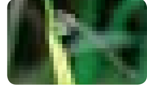
※生息場所については非公表。 問合先 環境課 生物多様性