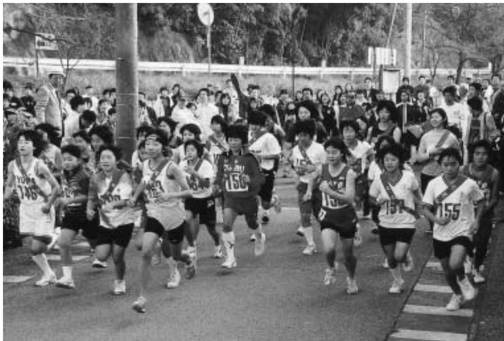
可児郷土歴史館（久々利）を出発する10.2kmコースの選手たち（昨年）