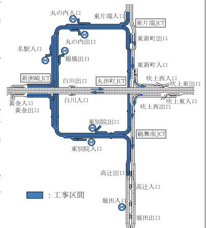
都心環状線リフレッシュ工事 工事区間

●問合せ先 名古屋高速道路公社保全施設部 ☎052(919)3202 ホームページ http://www.nagoya-expressway.or.jp/