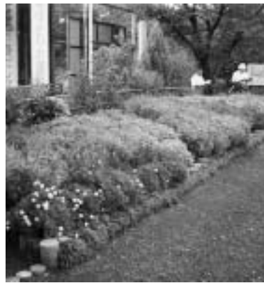
会長賞を受賞した愛岐ヶ丘自治会の花壇

動花壇コンクールの審査会が8月12日に行われ、優秀作品が決まりました。今年で14年目となるこのコンクールは、自治会などの単位で花苗をシールズを通じて育成管理し、その成果を発表するものです。今年度は18の団体が参加しました。