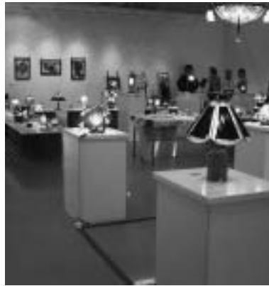
受講生の作品が並ぶ会場(昨年)

わくわく体験館は、平成16・17年度ガラス工芸講座の受講生作品を展示します。ぜひお出掛けください。