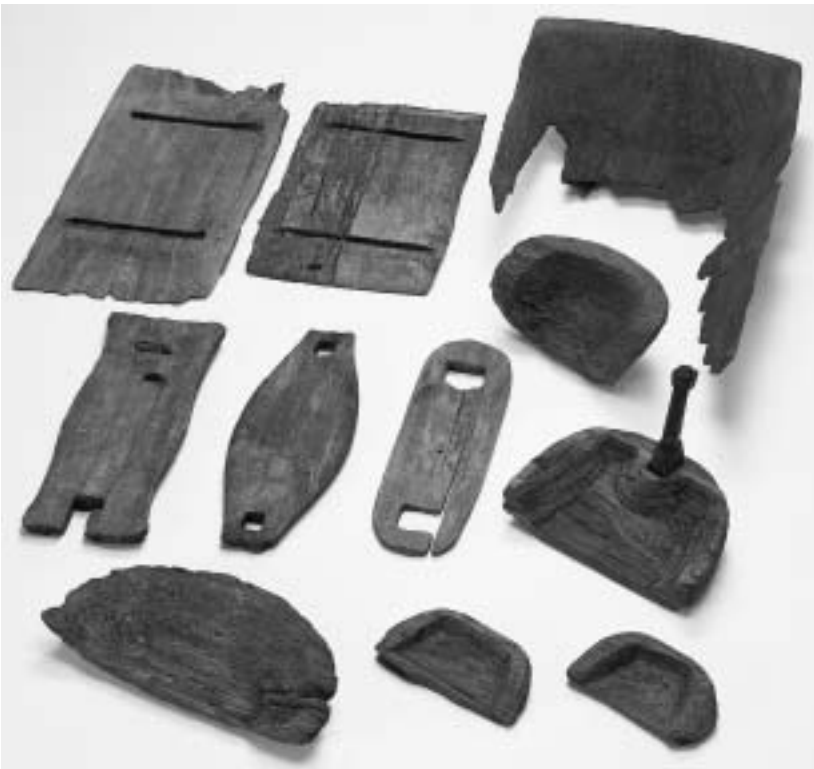
弥生～古墳時代の容器と家具

平成17年度の特別展として「発掘スペシヤル可児 埋もれていた柿田の歴史」を開催します。