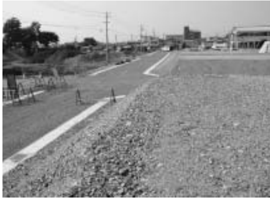
区画整理が進む可児駅周辺

市の玄関口である可児駅周辺の将来像について、ワークショップを開催します。そこで、市民の立場でアイデアを提案していただける人を募集します。