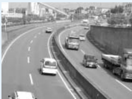
●問合せ 国土交通省岐阜国道事務所 管理第一課 ☎058(271)9817