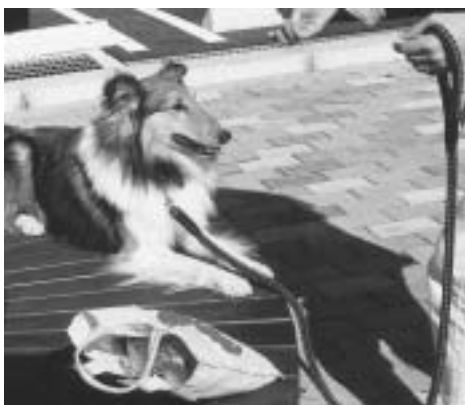
かわいいペットとの暮らしはルールを守って

近ごろ、犬などのふんが放置されることがあり、多くの人が困っています。飼い主の皆さんは、散歩に出掛けるときは必ず袋を持って行き、ふんを持ち帰りましょう。市は「ポイ捨て及びふん害の防止に関する条例」で、ふんの回収を義務付けています。犬と暮らすやすいまちにするために、マナーを守って飼いましょう。