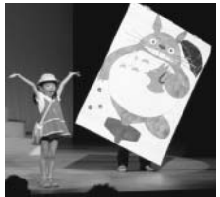
昨年は楽しいアニメソングの合唱を披露