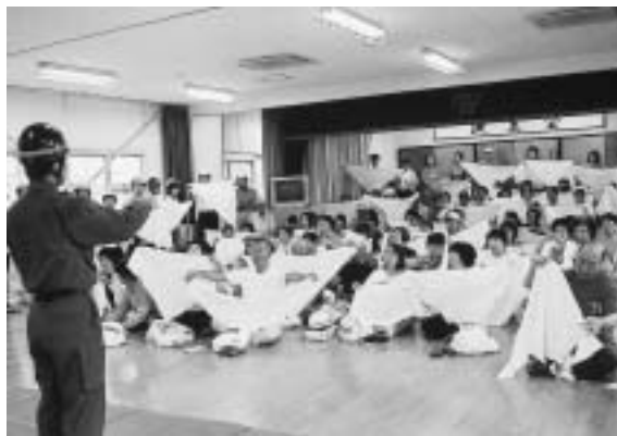
地元消防団に三角巾による応急手当を学ぶ参加者（昨年・鳩吹台）

大地震が発生したときは、救急車や消防車がすぐに災害現場に駆けつけることは出来ません。そのため、まずは自分・家族・地域を自分たちで守ることが大切です。