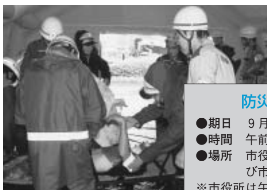
集団救急救命訓練に取り組む参加者（昨年・市役所）