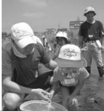
川で捕った生物をトレーに分類する親子連れ (いずれも可見川・市役所北)