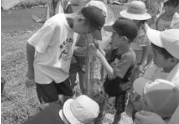
透視度計をのぞき、水の濁りを調べる参加者