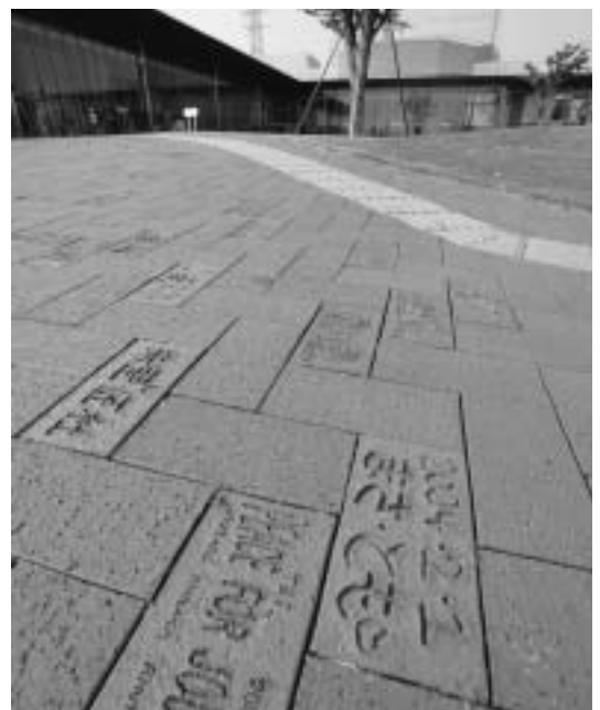
アーラに埋め込まれているレンガ