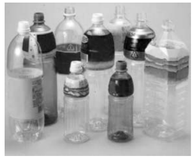
ラベルとキャップリングは、そのままOK!