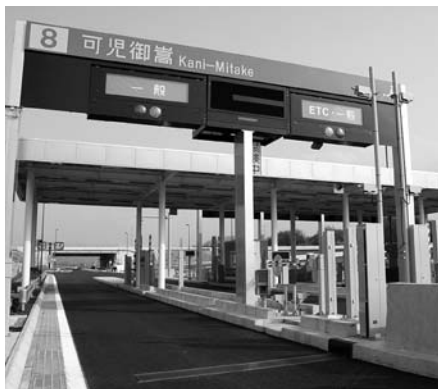
開通を待つ可児御嵩インターチェンジ料金所

国土交通省中部地方整備局と日本道路公団が整備を進めてきた東海環状自動車道が、三月十九日午後三時に開通します。今回開通するのは、豊田東ジャンクションから美濃関ジャンクションまでの間七十三キロメートルです。これに伴い、市東部にある可児御嵩インターチェンジも利用が可能になります。同自動車道は、名古屋市の周辺三十〜四十キロメートル圏に位置する可児市をはじめ、岐阜、豊田、土岐などの都市を結び、延長約百六十キロメートルの環状道路で、東名・名神高速道路および中央・東海北陸・東名阪・伊勢湾岸の各自動車道などと一体となって、