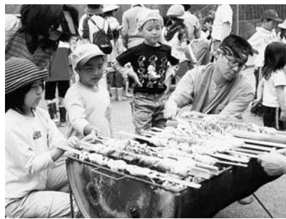
パン作り体験の様子(昨年)

和良ふれあい農園 自然の中で農業体験を 和良夢づくり塾は、家族で一緒に農業体験などをしてもらう「和良ふれあい農園」の参加者を募集します。