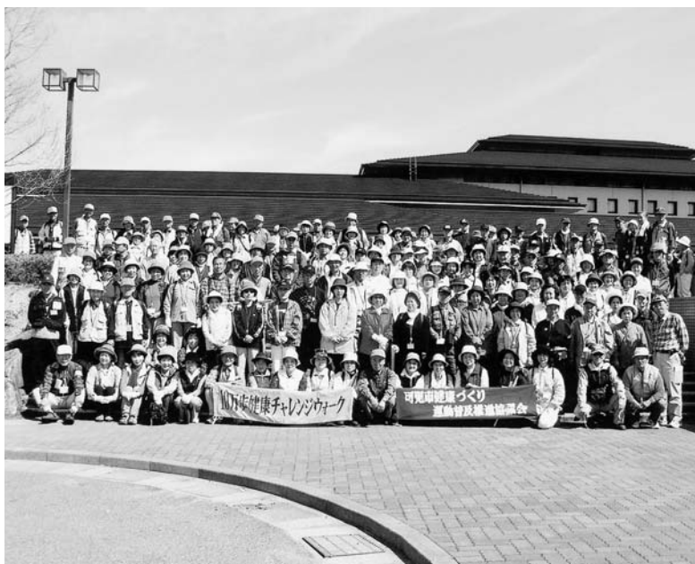
チャレンジウォークに参加した皆さん（昨年4月・桜ヶ丘）