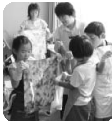
藍染めを体験する参加者(昨年)