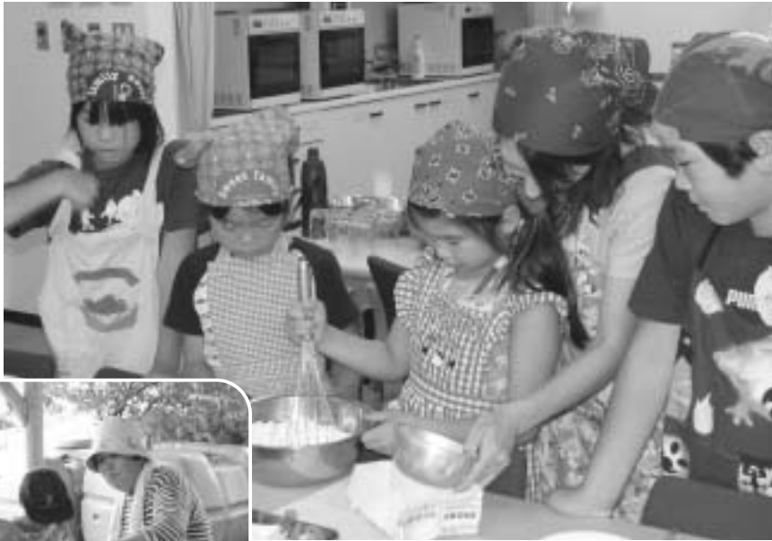
エコッキングを楽しむ参加者 (上) と里山で人形作りをする参加者 (左) (いずれも昨年)