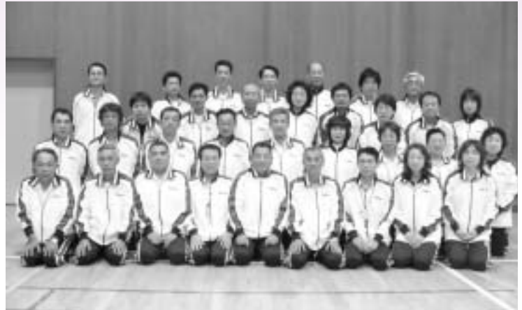
平成18・19年度体育指導委員の皆さん