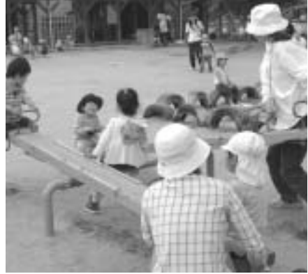
保育園の園庭で遊ぼう