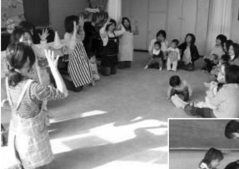
公民館の乳幼児学級で活動するボランティアの皆さん