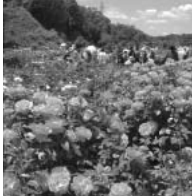
バラが満開のバラ園

花フェスタ記念公園は、開園10周年を記念して、お得なパスポートを販売しています。