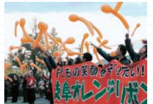
虐待ゼロへの思いを込めて 風船を飛ばしました

児童虐待防止の象徴であるオレンジリボンをたすきにして、中津川市から岐阜市までの約100キロメートルをつなぐ「岐阜オレンジリボンたすきリレー」が11月23日・24日に行われました。初日のゴール地点となった可児市役所では、ダンスの披露やブラスパンドの演奏、豚汁の配布などといったイベントが行われました。参加者はオレンジ色の風船を飛ばし、虐待防止を祈りました。また、2日目は市の職員代表10人が市役所を出発し、太田宿（美濃加茂市）までの5・7キロメートルを走り、次の走者に思いを込めたたすきをつなぎました。