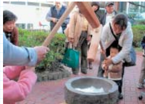
おいしいおもちになあれ

11月30日、福祉センターで「かにNPOフェスタ」が開催されました。市内外から約40団体が参加し、活動紹介やステージ発表などが行われました。 会場内では、各ブースを回ることで答えが分かる環境クイズやもちつき体験など体験型のイベントや、大気環境木（ハナズオウ・ムクゲ）の無料配布なども行われました。 ほかにも、手づくりのパンやお菓子、小物などの販売コーナーがあり、雑貨や食べ物を買い求める約800人の来場者でにぎわいました。