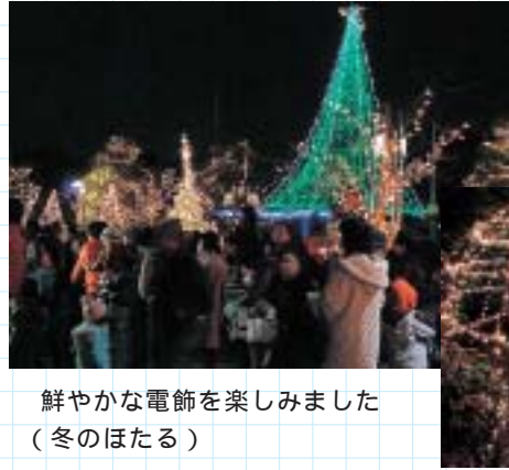
鮮やかな電飾を楽しみました (冬のほたる)

その後、可児商工会議所青年部の「ベルリンス」がハンドベルの演奏を行い、来場者たちは美しい音色に聞き入り、盛大な拍手を送りました。 冬のほたるは1月12日（月・祝）まで、毎日点灯されます。