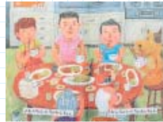
大賞作品 「わんちゃんのちゃんちゃん」