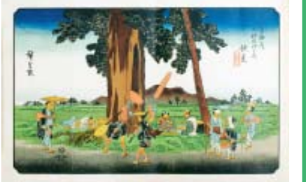
歌川広重の描いた大木

波の犬山街道沿いには、その昔大きな杉の木が立っていました。これは、江戸時代に歌川広重が描いた「木曾街道六十九次