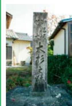
大杉を記録した石碑

の内 伏見」に登場する大杉であるともいわれています。絵画には、人々が大杉の木陰で休憩をとる様子が描か