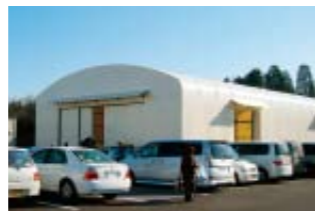
可児市エコドーム外観