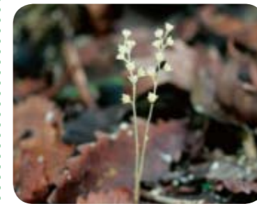
平成21年7月30日に撮影