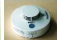
住宅用火災警報器

秋の火災予防運動 消えるまで ゆっくり火の元 11月9日から15日まで、全国一斉に秋の火災予防運動が実施されます。空気が乾燥し火災が発生しやすくなっています。火の元には十分注意してください。 住宅用火災警報器の設置を 火災で亡くなる人の多くは逃げ遅れによるものです。煙の中に含まれる一酸化炭素を吸うと、体がまひし、逃げられなくなってしまう。火災の発生を早く知ることが最も重要です。 「住宅用火災警報器」は、平成23年5月31日までに設置が義務付けられています(新築住宅は、既に義務化)。 ○すべての寝室、階段の天井に煙式を取り付けてください(台所は努力義務) ○家電販売店やホームセンターで取り扱っています。消防署員が販売することはありませんので、不審な訪問販売にはご注意ください。 問合先 防災安全課