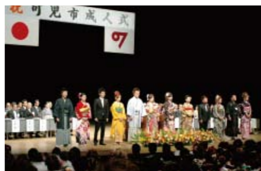
平成21年成人式の様子

参加を希望する人は12月15日(火)までに、生涯学習課に備え付けの成人式参加申込書に必要事項を記入して提出するか、電子メールに住所、氏名、生年月日を明記して生涯学習課(syogaigakusyu@city.kani.lg.jp)へ送付してください。市のホームページからも申し込むことができます。 その他 当日は、受け付け順に前から詰めての着席となります。友人と一緒に着席を希望する場合は早めにお申し付けください(会場の都合により希望に沿えない場合もあります)。