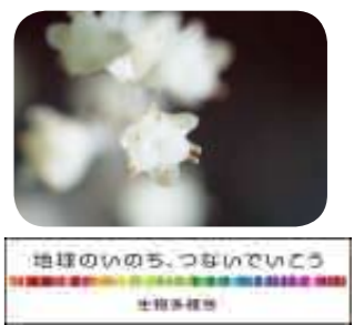
問合先 環境課、文化振興課