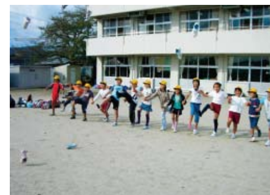
校庭で靴飛ばしゲームに挑戦 (昨年のオリエンテーリングの様子)

児童数：495人 学級数：19クラス 所在地：塩642-1 電話：65-2063