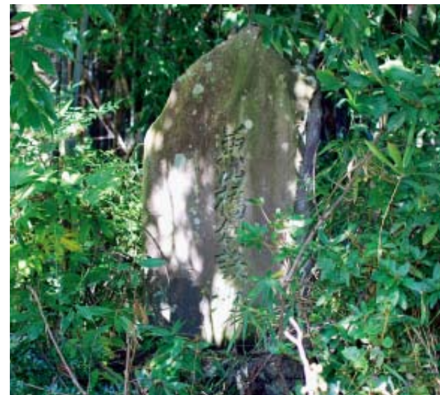
兼山橋の跡地にひっそりたつ石