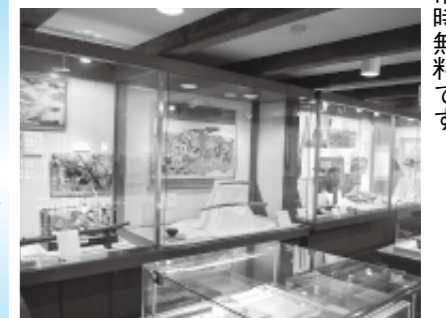
兼山歴史民俗資料館

時間 午前9時～午後4時30分 ※川合考古資料館(川合公民館内)は常時無料です。