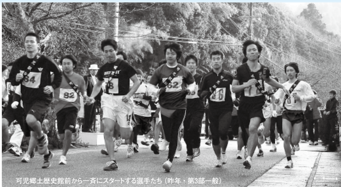
可児郷土歴史館前から一斉にスタートする選手たち (昨年・第3部一般)