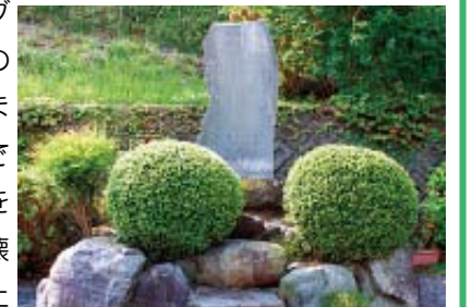
福田寺にある震災記念碑

明治24(1891)年10月28日、本巣郡根尾村を震源地とするマグニチュード8.4の大地震が発生しました。この地震での死者は7千人を超え、建物の全壊も14万2千戸以上