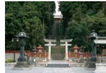
▼塩竈神社