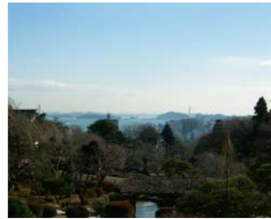
▲現在の塩竈湾