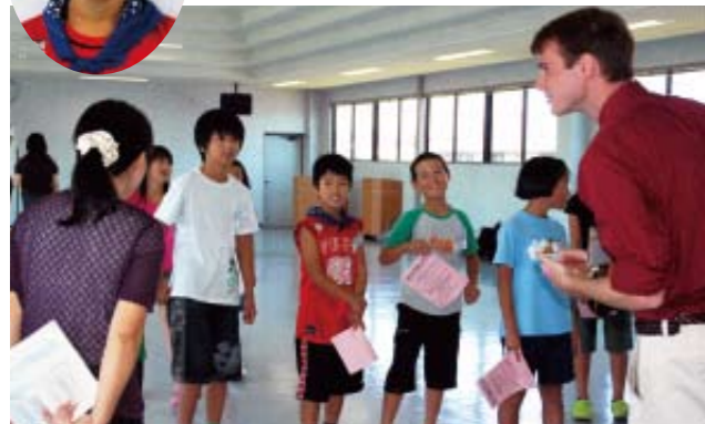
ちゃんと英語で話せるかな (総合会館分室にて)