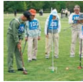
カップイン(昨年の様子)

可児市ゴルフ協会 会員を募集 目的 アマチュアゴルフの健全な発展と、市民の体力向上に寄与する 問合せ スポーツ振興課 ☎②8603