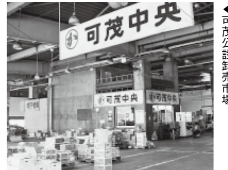
可茂公設卸売市場