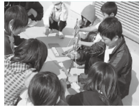
▼昔の人の生活体験(可児郷土歴史館)