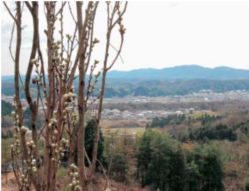
春の訪れを感じていち早く咲くことから、春告草（はるつげぐさ）とも呼ばれます。つぼみが大きくなるにつれて、寒さが和らいでいくのを感じます。（兼山）