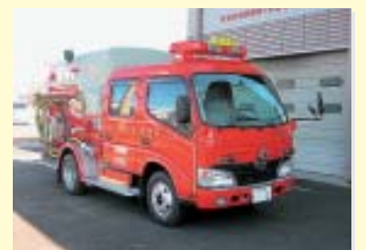
広見東部消防団ポンプ自動車

市は、電源立地地域対策交付金を財源にして広見東部消防団ポンプ自動車更新事業、市営城山住宅屋根外壁改修工事を行いました。