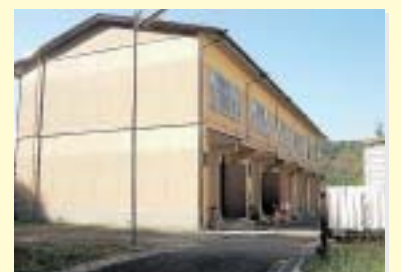
市営城山住宅（兼山）