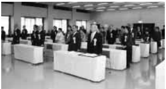
表彰式に出席された受賞者の皆さん