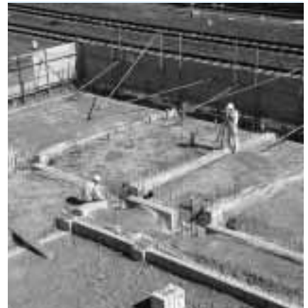
建設が進む多文化共生センター

今後、可児市多文化共生センターが、「フレビア」の愛称で皆さんに親しんでいただける施設となるよう、期待が膨らみます。