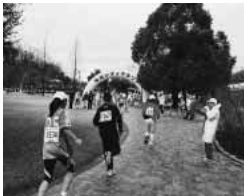
ゴールへ最後の力走をする選手たち(昨年の様子)