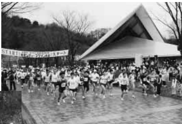
一斉にスタートする選手たち