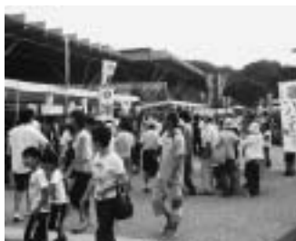
にぎわう縁日の様子(昨年)