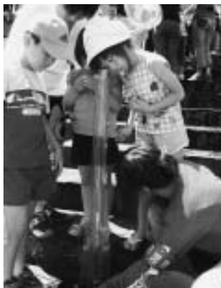
透視度計で川の水の にごりを調べています