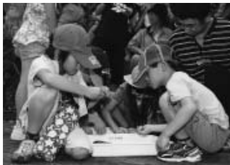
「何がいるかな？」 水生生物を種類ごとに分けています